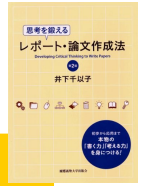
『思考を鍛えるレポート・論文作成法』