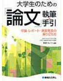
『大学生のための「論文」執筆の手引』